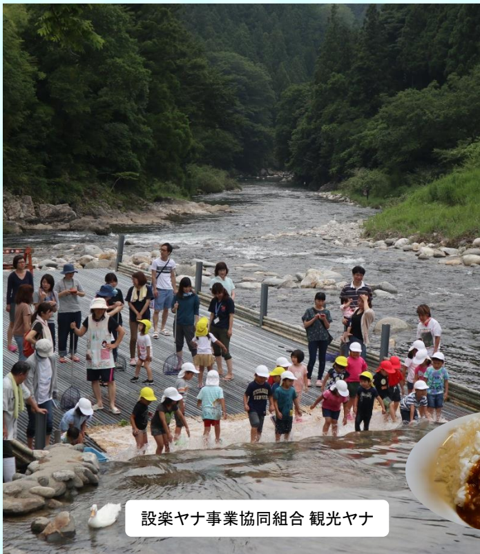
設楽ヤナ事業協同組合 観光ヤナ